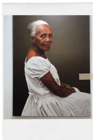
Obras: "Adela" y "Ana" por Ruby Rumié

De Colombia se encuentran las fotografías de Tejiendo Calle, de la artista colombiana Ruby Rumié , un intento por rescatar de la invisibilidad y del olvido a muchas mujeres han dedicado valiosos años de su vida a la venta ambulante recorriendo permanentemente los barrios de Cartagena, Colombia.