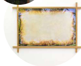
Obra: "Resistance of Memory" por Carlos Vergara