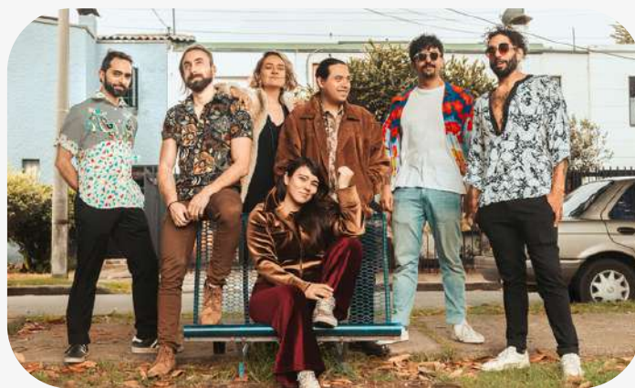
La Sonora Mazurén estará en Viena del 30 de octubre al 3 de noviembre.

Noviembre abre la puerta en escena de una de las temporadas más esperadas por algunas culturas. La navidad. Austria y otros países empiezan a vestir sus calles con los colores rojo, verde, azul y blanco. La temperatura ha empezado a descender. Sin embargo, esto no presenta algún impedimento para disfrutar de las actividades que se ofrecen.